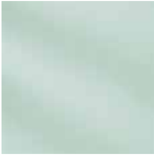
301V / NT (R9) 304V / NT (R10)