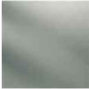
311V / NT (R9)