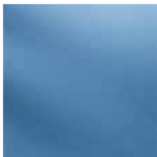
314V / NT (R9)