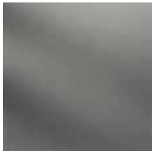
312V / NT (R9)